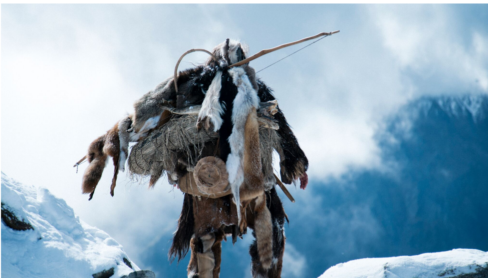
Das Bild wurde von einem Set-Fotografen im Rahmen der Dreharbeiten aufgenommen. Es stammt nicht aus dem Film, zeigt aber gut das Kostümbild.

Bewerten Sie im gemeinsamen Gespräch die filmische Darstellung des menschlichen Lebens in der Jungsteinzeit. Inwiefern scheint Ihnen diese stimmig zu sein? Welche Elemente passen Ihrer Meinung nach nicht – und warum?